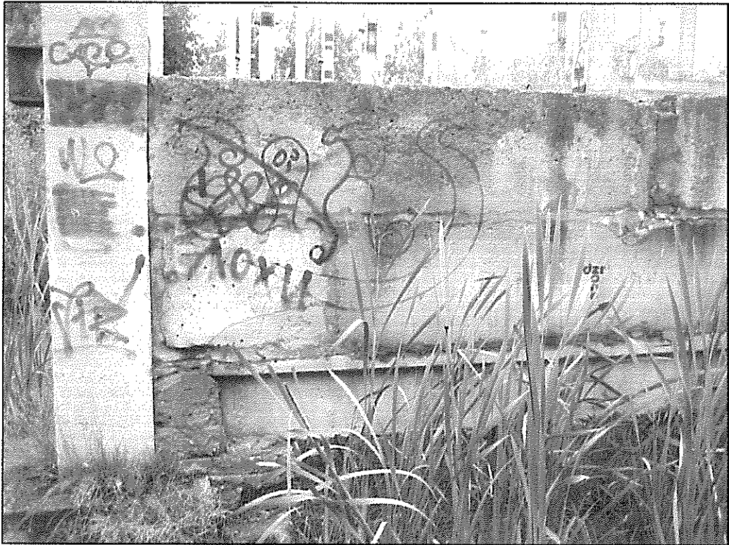
Вид на внутреннюю стену подвала по оси «б» м/о «В-Д».