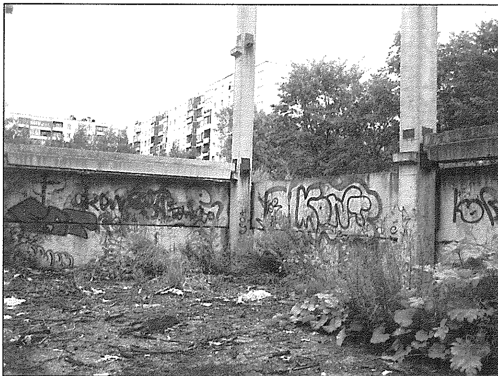
Вид на элементы каркаса в осях «Л-М» м/о «3-4».