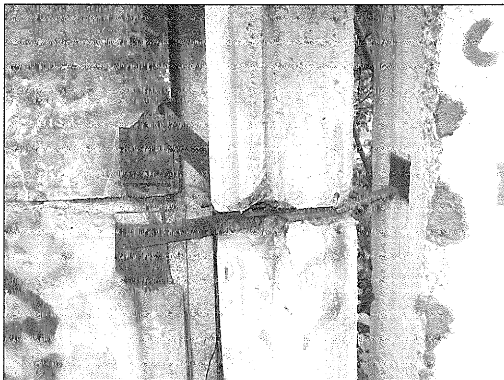
Фрагмент крепления стеновых панелей между собой и к колонне.