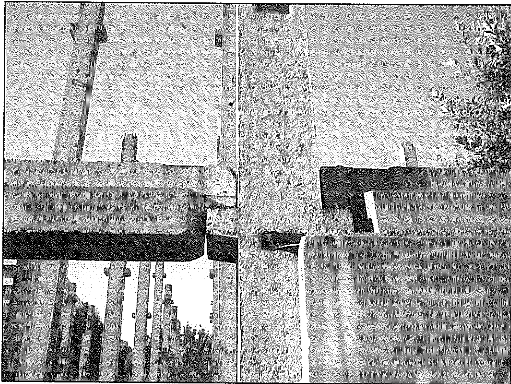
Узел опирания ригеля на крайнюю колонну.