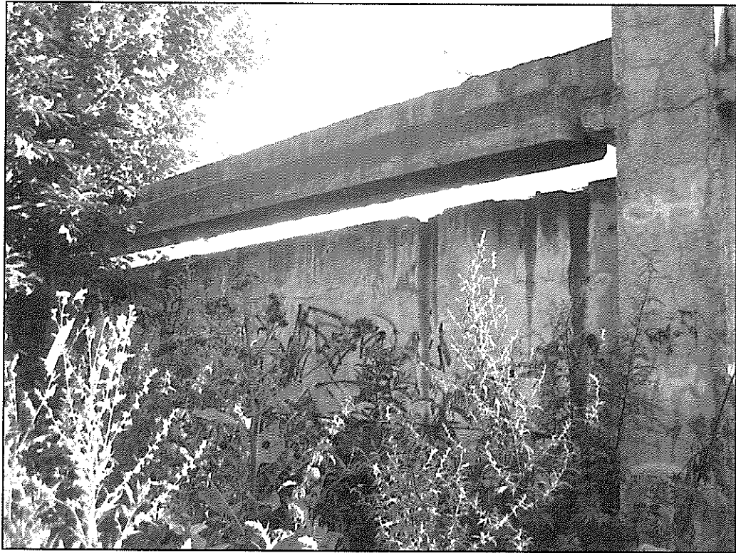
Вид на элементы каркаса и стеновую панель.