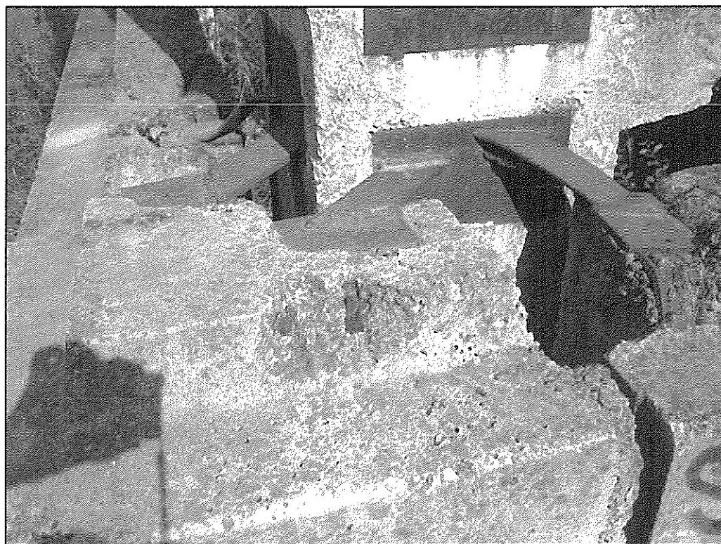
Фрагмент крепления стеновых панелей к колонне.