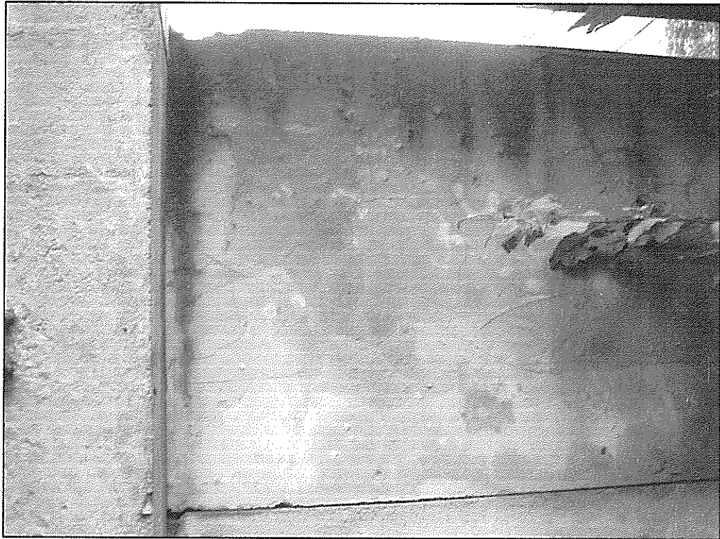
Вид на стеновые панели.