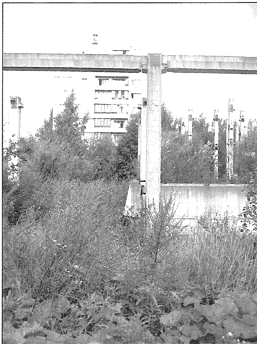
Вид на элементы каркаса и стеновую панель по оси «Б» м/о «6-7» вышедшего из проектного положения.