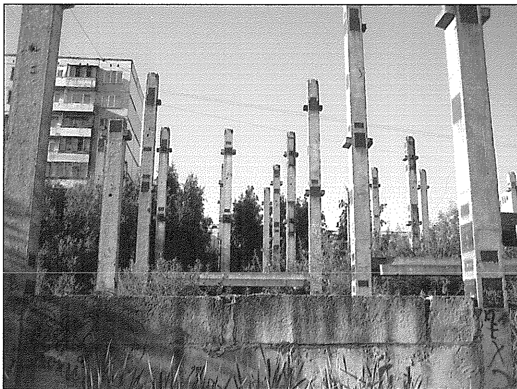
Вид на элементы каркаса.